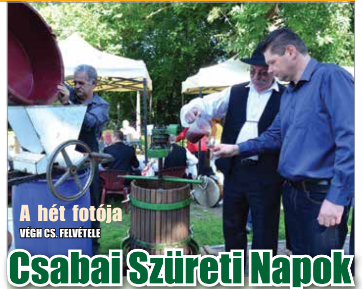
A hét fotója