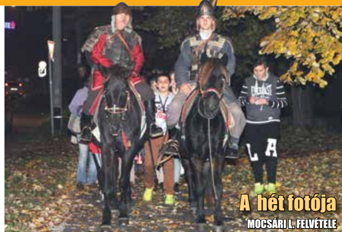
A hét fotója