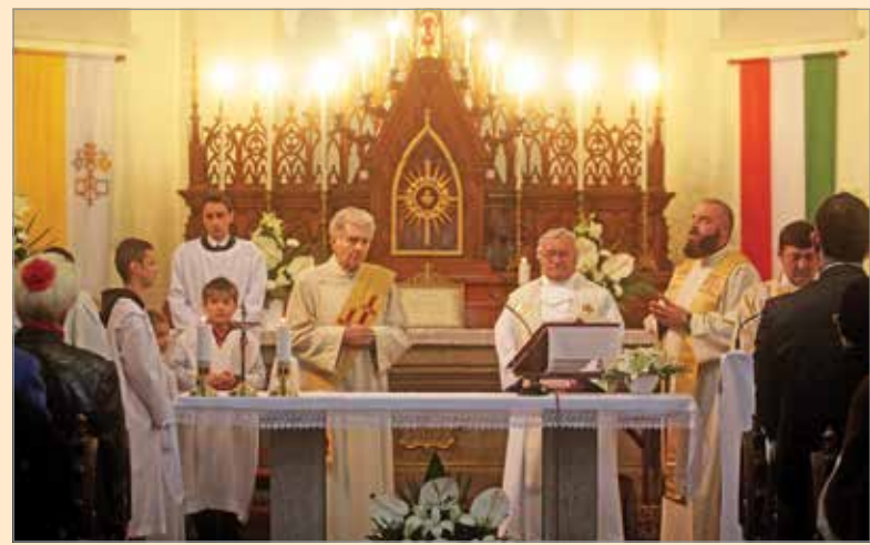
Az újdísgyőri Szent Imre-templom búcsúünnepén, november 9-én.

arról szö- vezték, hogy a miskolci kereszténydemokraták mindig építő szándékkal tettek a városunk eszméi és kulturális fejlődéséért. Javaslatunkra örzi sétány Szent Erzsébet nevét, és ugyancsak kezdeményezői voltak a diósgyőri Szent II. János Pál tér kialakításának, névadásának. Mivel úgy gondolják, hogy II. János Pál szellemi örökségét a keresztény kultúra és hit megélésében is ki kell bontakoztatni, elsőként támogatják és hívják fel a figyelmet a nem mindennapi eseményre, hogy Miskolcra érkezik a katolikus ifjúsági világtalálkozókat keresztje. – Ez az alkalom arról szól, ami összeköt, és nem arról, ami elválaszt! A miskolci kereszténydemokraták e mellett teszik le a voksukat – mondta végezetül.