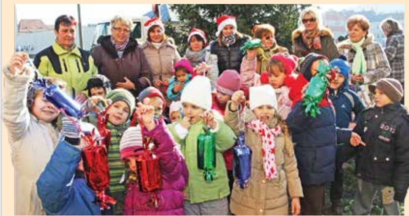
Ebben az évben a Brunsvik Teréz tagóvoda apróságai díszítették fel a Vologda városrész karácsonyfáját.

A Luther Kórus és a Fazekas Női Kar ad közös karácsonyi koncertet december 20-án, szombaton délután 4 órától a belvárosi evangélikus templomban.