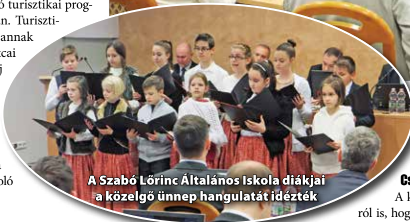
A Szabó Lőrinc Általános Iskola diákjai a közelgő ünnep hangulatát idézték

testület viszont úgy döntött, hogy nem fogadja el a kormányhivatal észrevételét és fenntartja a hatályos szabályozást. A városvezetés ragaszkodik ahhoz, hogy ne lehessen életvitelszerűen lakni emberhez méltatlan körülmények között Miskolcon.