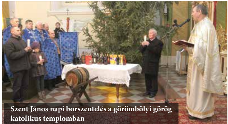
Szent János napi borszentelés a görömbölyi görög katolikus templomban

Az utóbbi éveket értékelve megtudtuk, 2010-ben nagyon hideg és csapadékos volt az időjárás, ami nem tett jót a növényeknek, így a szőlőnek sem. A 2011-es év már némileg jobb volt, míg 2012/2013-as aszályt hozott, ami az utóbbi évben kimondottan jó minőséggel járt együtt. Ezt idén egy újabb, nem túl jó év követte a borászok szempontjából.