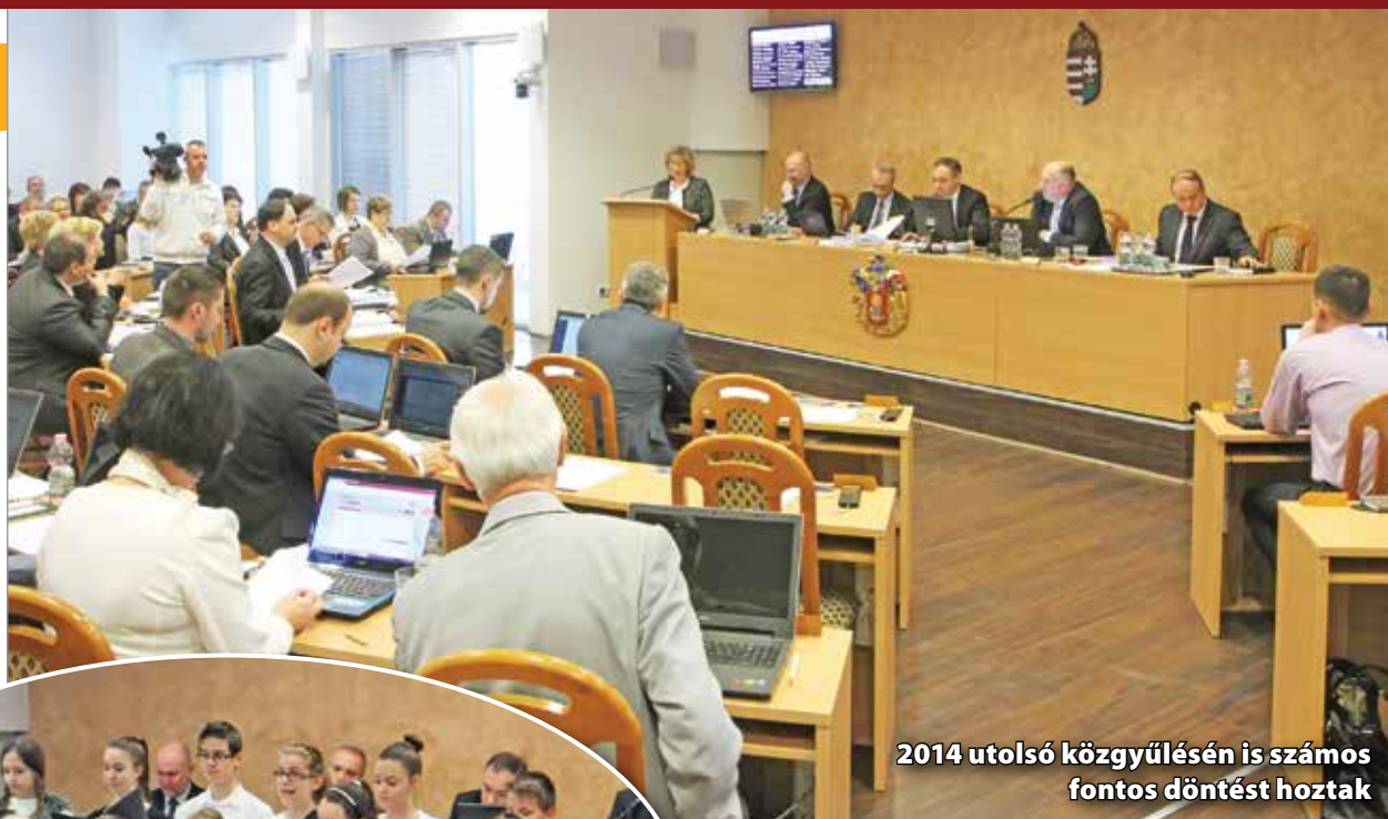
2014 utolsó közgyűlésén is számos fontos döntést hoztak

A közgyűlés foglalkozott a nyomortelepek felszámolásával kapcsolatos önkormányzati rendellel. A kormányhivatal felülvizsgálatra kérte az önkormányzatot, mert szerintük az magasabb jogszabályokat sért. Elsősorban arra hívták fel a figyelmet, hogy az önkormányzat ne határozza meg, hogy mekkora lakótér jusson egy lakóra. A