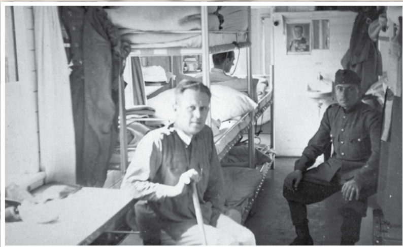
Lábadozó katonák egy kórházvonaton

A tudós-múzeumigazgató háborús naplója 1944. november 3-tól 1945. március 23-ig fogja át Miskolcon megélt tapasztalatait. Hogy mennyire szól ez a családnak és az utókorunk, kiderül az alábbi részletekből.