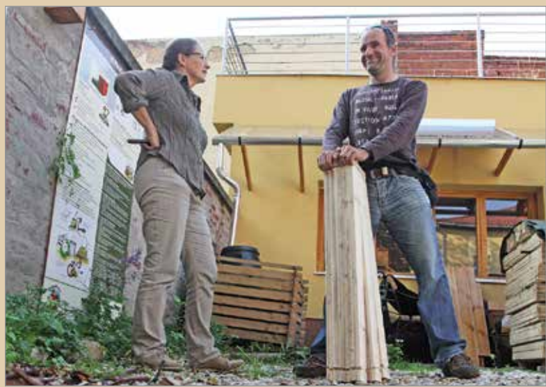
Sikeresen működik a komposztálási program