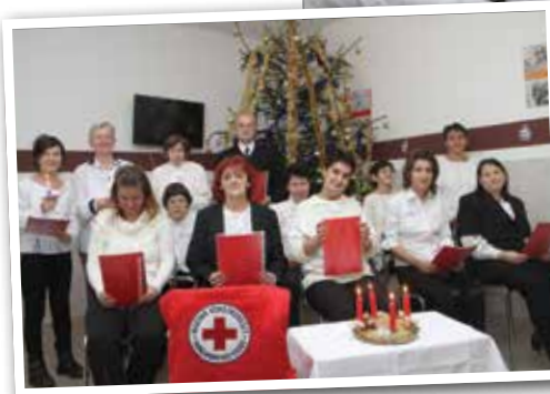
Próbálják a karácsonyi műsort a Vöröskereszt hajléktalanszállóján