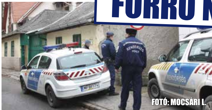
FOTÓ: MOCSÁRI L.

Saját lakásában, több kézzúrással gyilkoltak meg múlt szombaton egy 66 éves, miskolci férfit, az Avasalja úton. A környéken szinte mindenki ismerte az áldozatot, aki háztartási gépek javításával foglalkozott, ezért rengetegen jártak hozzá. Azt egyelőre nem lehet tudni, hogy a gyilkost ő maga engedte-e be a házba. Az egyik szomszéd szerint az idős férfi megpróbált elmenekülni a támadója elől. A konyhába zárkózott, de a gyilkos oda is bejutott, és többször megszurta a nyugdíjast – állítólag tizenegy kézzúrást találtak az áldozaton. Gaskó Bertalan, a B.-A.-Z. Megyei Rendőr-főkapitányság szóvivője hivatalosan annyit erősített meg, hogy a helyszíni szemle eredményei alapján az idős férfi halálát idegenkezűség okozta. A rendőrség emberölés miatt, ismeretlen tettes ellen indított nyomozást.