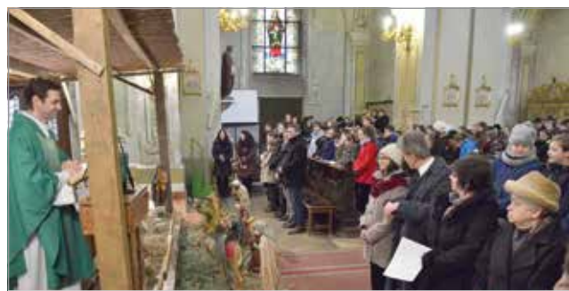
Szentmise a Fráter György Katolikus Gimnázium diákjai számára február 1-jén a minorita templomban

Február 11-én , a betegek világnapján a megyei kórház kápolnájában 10 órától Palánki Ferenc egri segédpüspök mutat be szentmisét a miskolci katolikus papság részvételével. Ezen a napon az esti szentmiseken kiszolgáltatják a betegek kenetét.