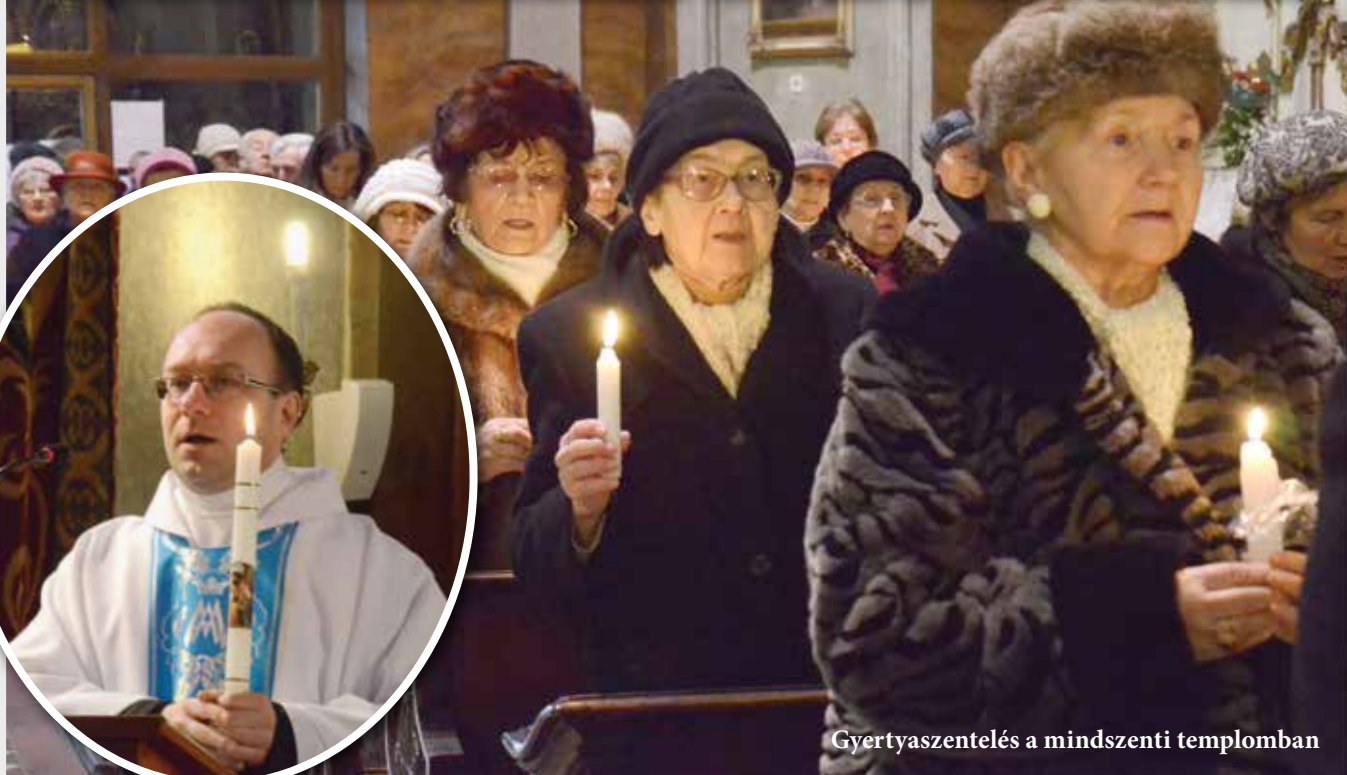
Gyertyaszentelés a mindszenti templomban

Szűz Mária negyven nappal Jézus születése után bemutatta a jeruzsálemi templomban a gyermekét, akit a nemzetek megvilágosítására szolgáló világosságnak nevezett. Innen ered a gyertyaszentelés szokása. Régen a szentelt gyertyát, Jézus egyik legrégebbi jelképét az újszülöttek mellett tartották a rontó szellemek távol tartására a keresztelés napjáig. Szentelt gyertyát égettek gégeső, vihar, villámlás, illetve krónikus betegek és halottak mellett is – volt, ahol a haldoklók kezébe helyezték. Magyarországon máig megmaradt az ünnep régi neve: Gyertyaszentelő Boldogasszony.