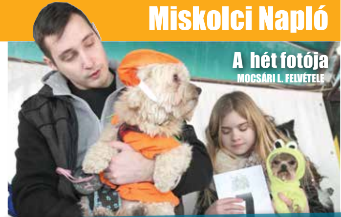
A hét fotója