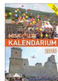
MISKOLC 2015 KALENDÁRIUM

Idézzük fel együtt a Kocsonya Farsang hangulatát! Legújabb rejtvényünkben ismert fellépők neveit rejtettük el. Kérjük, a megfejtéseket együtt, legkésőbb 2015. március 11-én éjfélig juttassák el szerkesztőségünkbe (3525 Miskolc, Kis-Hunyad u. 9.) vagy az info@mikom.hu e-mail címre. A helyes megfejtést beküldők között egy-egy 2015-ös Miskolci Kalendáriumot sorsolunk ki.