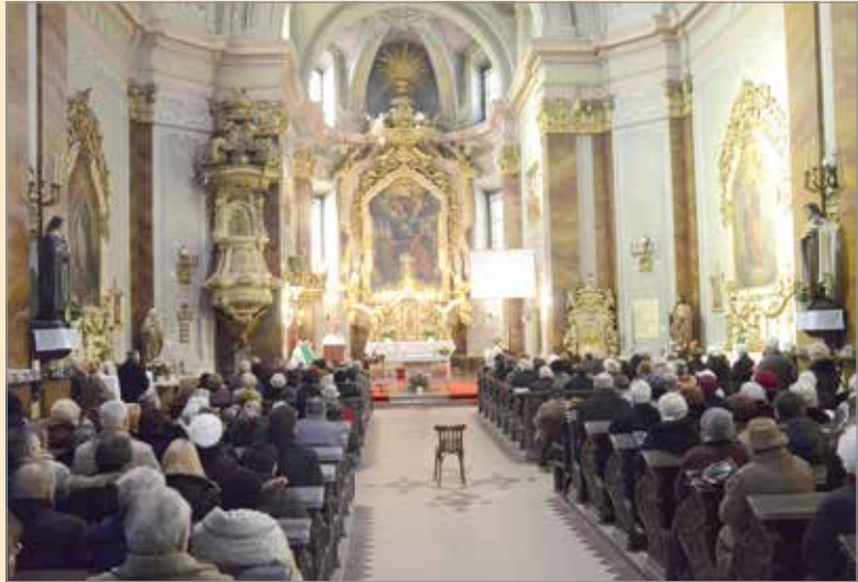
A betegek szentségének kiszolgáltatása a Mindszenti templomban, február 15-én.