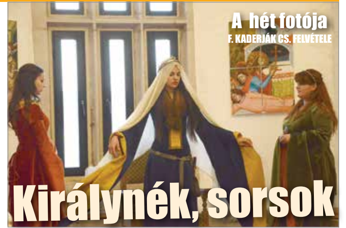
A hét fotója