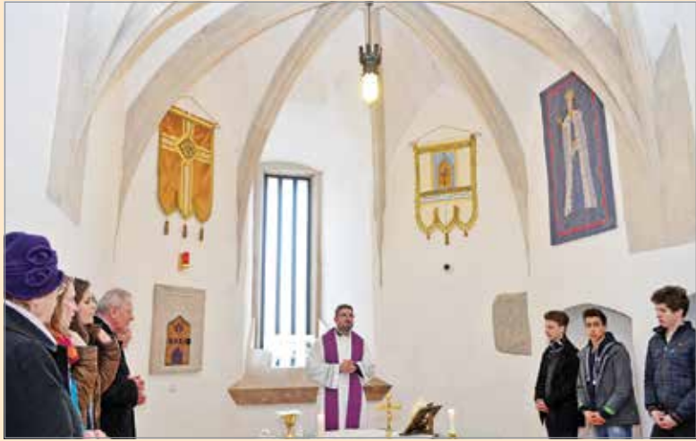
Februári szentmise a diósgyőri vár felújított kápolnájában