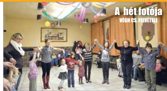
A hét fotója

Már a tavaszt idézték a színek és a hangulat a napokban a VOKE Vörösmarty Mihály Művelődési Ház gyermek- és felnőtt táncszobájában.