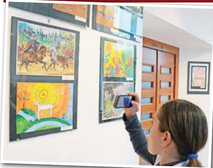
A Kómlótetői Általános Iskola „Magyar Vagyok... Határtalanul” – című rajzpályázatának kiállítása volt a nyitórendezvénye csütörtökön az idei, március 15-i miskolci ünnepsorozatnak.