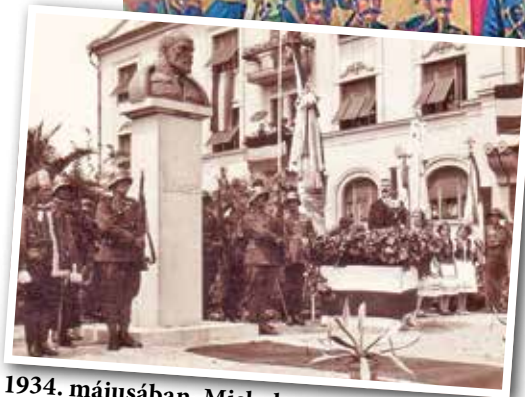
1934. májusában, Miskolcon avatták fel az ország első Görgey szobrát.

Az 1849. szeptember 2-án kivonuló oroszokat az osztrákok váltották, és azonnali kényszersorozásokat hirdettek meg. A rendfenntartó zsoldosok első képviselői 1850. augusztus 20-án érkeztek meg a városba, laktanyájuk a mai Színészmúzeum helyén állt. A sajtótermékeket betiltották, így a lakosság csak az utazóktól, bujdosó honvédektől kaphatott némi információt az országban törtétekről. A városba nagy számmal