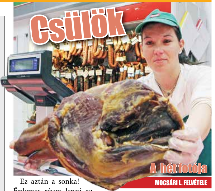
A hét fotója

Az elmúlt évek hagyományait követve, ünnepi megemlékezést és koszorúzást tartottak múlt pénteken Miskolc-Görömbölyön a Rákóczi szobornál, a Nagyságos Vezérlő Fejedelem születésének 339. évfordulója alkalmából. A résztvevők a görömbölyi iskolánál gyülekeztek, innen vonultak fel lovas kurucok kíséretével a Rákóczi szoborhoz, ahol közösen idézték meg a fejedelem emlékét. A kulturális programot követően koszorút helyeztek el a szobor talapzatán. A rendezvény szervezője a Rákóczi Szövetség Miskolc-Görömbölyi Szervezete és a RUKISÖSZ Közhasznú Egyesület, támogatója Nehéz Károly önkormányzati képviselő volt.