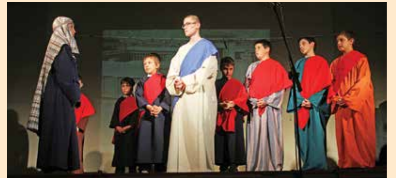
Hittanos gyermekek passiójátéka a Mindszenti plébánia Millenniumi-termében

Nagyszombaton a feltámadási szertartás és körmenet 20 órakor kezdődik a Mindszenti és a Minorita-templomban. Húsvétvasárnap a szokott ünnepi miserend lesz érvényben minden templomban. Vasárnap az első, reggeli szentmiséken ételmegáldást végeznek. Húsvéthétfőn a meghirdetett időpontokban lesznek szentmisék. A Mindszenti vasárnapi miserend lesz, de a Zárdakápolnában reggel és a Kálvária-kápolnában nem lesz szentmise. A Minorita templomban a fél 10 órás szentmise marad el hétfőn.