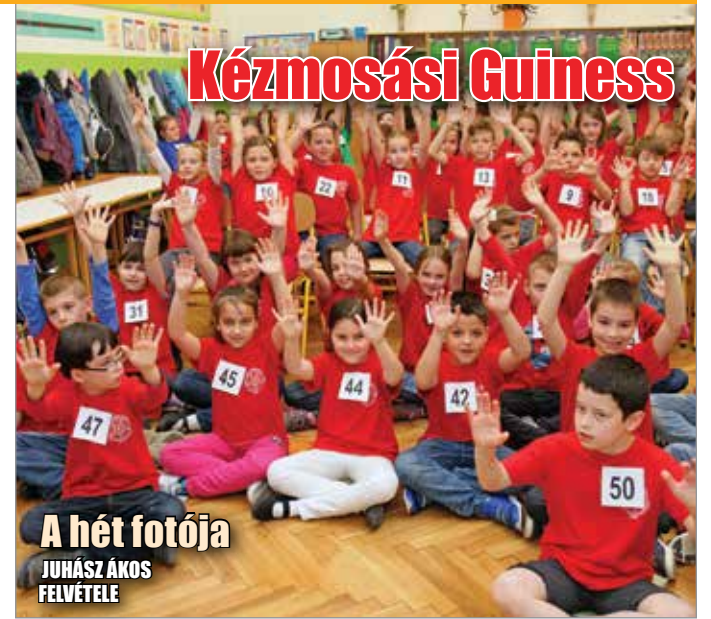
A hét fotója

Május 5-én volt a kézhigiénés-világnap, az Egészségügyi Világszervezet „Ments életeket: moss kezet!” elnevezésű kampányával a fertőzések megelőzésére kívánja felhívni a figyelmet. A világnap alkalmából az Országos Tisztifőorvosi Hivatal Guinness-rekordkísérletet szervezett: országszerte 160 helyszínen mintegy 14 000 diák csatlakozott a helyes kézmosást, fertőtlenítést reklámozó akcióhoz. Képünk a miskolci Kossuth Lajos Általános Iskolában készült.