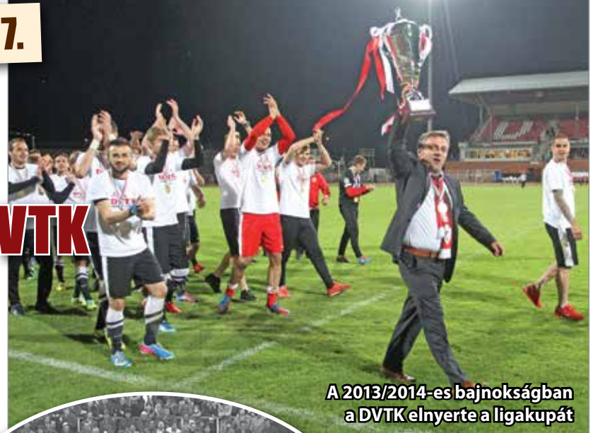
A 2013/2014-es bajnokságban a DVTK elnyerte a ligakupát