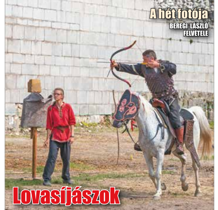
A hét fotója BEREGI LÁSZLÓ FELVÉTELE

Többször megpördült majd az árokba borult az M3-as autópályán egy Debrecenből induló turistabusz június 10-én reggel. A buszon 38 utas és két sofőr volt, 22-en sérültek meg. A balesetnek két súlyos, életveszélyes sérültje van – egyikük miskolci. A 72 éves utas hasi és mellkasi sérüléssel szállították be a Honvédkórházba, majd megműtötték. Jelenleg a Központi Aneszteziológiai és Intenzív Terápiás Osztályon ápolják. Állapota stabil, azonban többszörös sérülései miatt súlyos, életveszélyes. A busz éjszaka indult el Balmazújvárosról, s a baleset előtt húsz perccel tartottak kávészünetet, ekkor cseréltek a sofőrök. Sajtóinformációk szerint az új sofőr ennek ellenére elszundikált, ez okozhatta a balesetet.